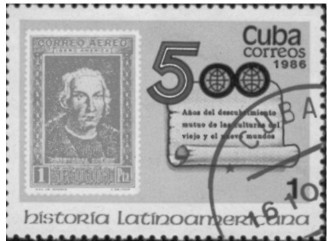
Abb. 4: Kubanische Briefmarke von 1986 mit Darstellung des Kolumbus auf einer spanischen Briefmarke von 1930

indianische Berichte Missverständnisse hervorrufen. Nicht allein die ungewohnte, in großem Stile betriebene Arbeit in den Goldwäschen war für die indianischen Männer zu viel. Ihre Familien und Gemeinwesen wurden zerstört. Die einfache Landwirtschaft mit dem Brandrodungsfeldbau vermochte diejenigen nicht mit zu ernähren, die der Lebensmittelerzeugung entzogen wurden. In der bisherigen Form der Nahrungsmittelproduktion waren keine ausreichenden Bevorratungsmöglichkeiten entwickelt worden. Das Hauptnahrungsmittel, Fladen aus Maniokmehl, musste ständig frisch hergestellt werden, konnte in dem feuchtheißen Klima zumindest nicht lange gelagert werden. Unter den neuen Bedingungen standen für die schwere Arbeit des Rodens und auch für die anderen landwirtschaftlichen Tätigkeiten weit weniger Arbeitskräfte zur Verfügung als ehemals. In dieser traditionellen indianischen Landwirtschaft war es schwer möglich, mehr zu produzieren und mehr Menschen zu ernähren.