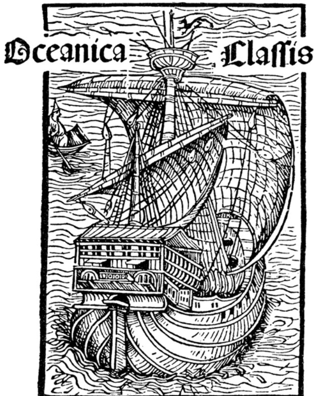
Abb. 3: Darstellung eines Schiffes (1486), das dem des Kolumbus ähnlich ist.

Im Gegensatz zu den Beobachtungen, die Kolumbus über die so gut wie unbekleideten Ureinwohner der Antillen niederschrieb, standen Hinweise auf ein Festland, das zehn Tagesreisen im Kanu entfernt wäre und wo die Menschen bekleidet gingen. Kolumbus vermerkte am 6. Januar 1493 etwas Derartiges in seinem Schiffstagebuch. Es war also die Kunde an sein Ohr gedrungen, dass es weiter westlich sogenannte zivilisierte Menschen gab. Wahrscheinlich bezogen sich diese Gerüchte auf die Maya der Halbinsel Yucatán.