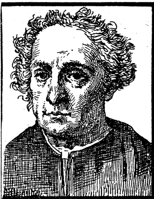
Abb.1: Portrait des Kolumbus, spätere Darstellung

Cristóbal Colón buscó el Oriente en dirección al Occidente. Comparó los taínos como los "buenos salvajes" con sus enemigos como " caníbales", pero declarando ambos grupos como mano de obra disponible para los españoles. Con esto empezó la subyugación de los autóctonos de las Islas Antillanas y su extirpación.