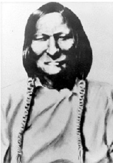
Leider existieren von Black Kettle keine guten fotografischen Aufnahmen.

Die Sutaio bestanden ursprünglich wohl aus vier Lagergemeinschaften, von denen drei im Norden blieben und sich eng mit den Omisis zusammenschlossen, während eine nach Süden wanderte und sich dort in enger Verbindung mit der Hisiometaneo-Band aufhielt. Jene südliche Suhtai-Gruppe stand unter der Führung eines Kriegers namens Black Shin und beteiligte sich 1865-66 an den Auseinandersetzungen zwischen den Southern Cheyenne und den USA.