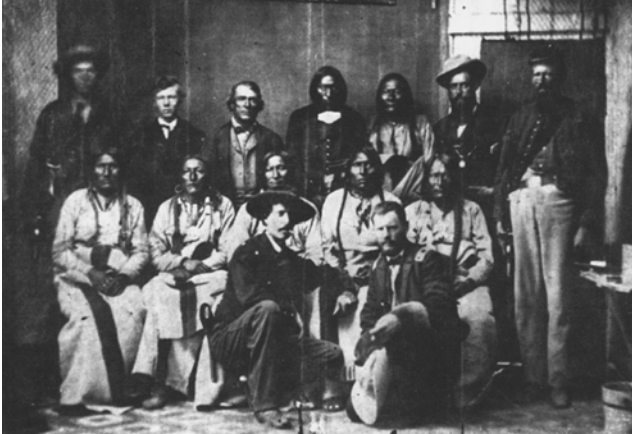
Black Kettle nahm 1864 an den Friedensverhandlungen von Camp Weld in Colorado teil. Sein Gesicht ist in der mittleren Reihe als 3.v.l. hinter dem Hut des Offiziers zu sehen.

Der historisch bekannteste Suhtai war zweifellos Häuptling Black Kettle (um 1801 - 1868), der eine Frau der Southern Cheyenne heiratete, unter diesen lebte und schließlich einer ihrer Häuptlinge wurde. Er starb, als die 7. US-Kavallerie unter Lieutenant Colonel George A. Custer sein Lager am Washita River angriff und über hundert Cheyenne, meist Frauen und Kinder, im Gewehrfeuer der Soldaten starben.