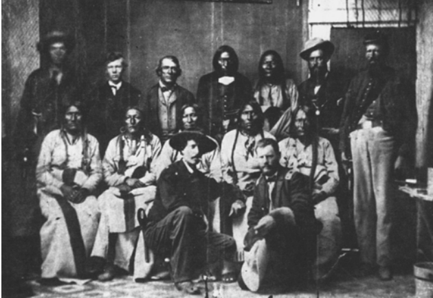
Black Kettle nahm 1864 an den Friedensverhandlungen von Camp Weld in Colorado teil. Sein Gesicht ist in der mittleren Reihe als 3.v.l. hinter dem Hut des Offiziers zu sehen.

Der historisch bekannteste Suhtai war zweifellos Häuptling Black Kettle (um 1801 - 1868), der eine Frau der Southern Cheyenne heiratete, unter diesen lebte und schließlich einer ihrer Häuptlinge wurde. Er starb, als die 7. US-Kavallerie unter Lieutenant Colonel George A. Custer sein Lager am Washita River angriff und über hundert Cheyenne, meist Frauen und Kinder, im Gewehrfeuer der Soldaten starben.